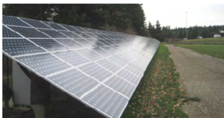
Рисунок 1. Солнечные батареи на магистрали солнечной энергии компании PGE

Фотогальванические системы вызывают интерес из-за стремления использовать возобновляемые источники электрической энергии. Для широкого распространения фотогальванической генерации необходим надежный способ их подключения к высоковольтной сети. PV Powered, производитель сетевых солнечных инверторов, объединился с компаниями Sensus, Northern Plains Power Technologies, Portland General Electric (PGE) и SEL, чтобы решить проблемы, связанные с интеграцией распределенной генерации солнечной энергии. Работу финансировало Министерство энергетики США в рамках программы систем интеграции энергосистемы солнечной энергии (Solar Energy Grid Integration Systems, SEGIS). Испытания, проведенные на магистрали солнечной энергии компании PGE, продемонстрировали эффективность использования глобальных измерений для интеллектуального предотвращения автономной работы.